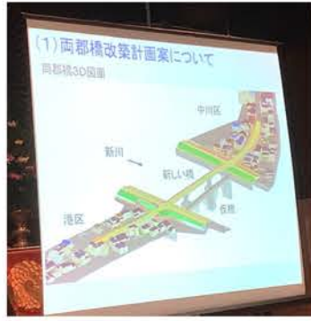
橋のかさ上げ工事を先に説明しました。まず、橋梁・堤防部完成時の形状案